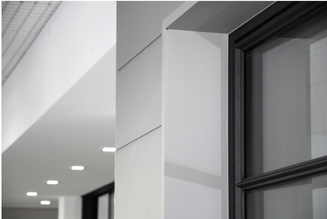
Dettaglio della finestra Slim Line 38 Classic