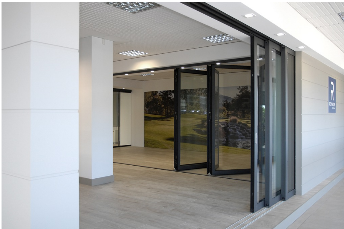
In primo piano: alzante scorrevole CP 130-LS pocket solution con ante che scompaiono nella parete e guide a filo pavimento; sullo sfondo: scorrevole a libro CF 77