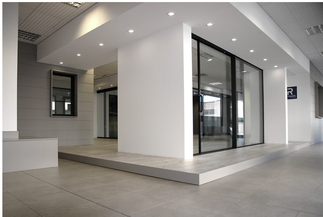
A sinistra: finestra Slim Line 38 Ferro; in primo piano: scorrevole minimal Hi-Finity