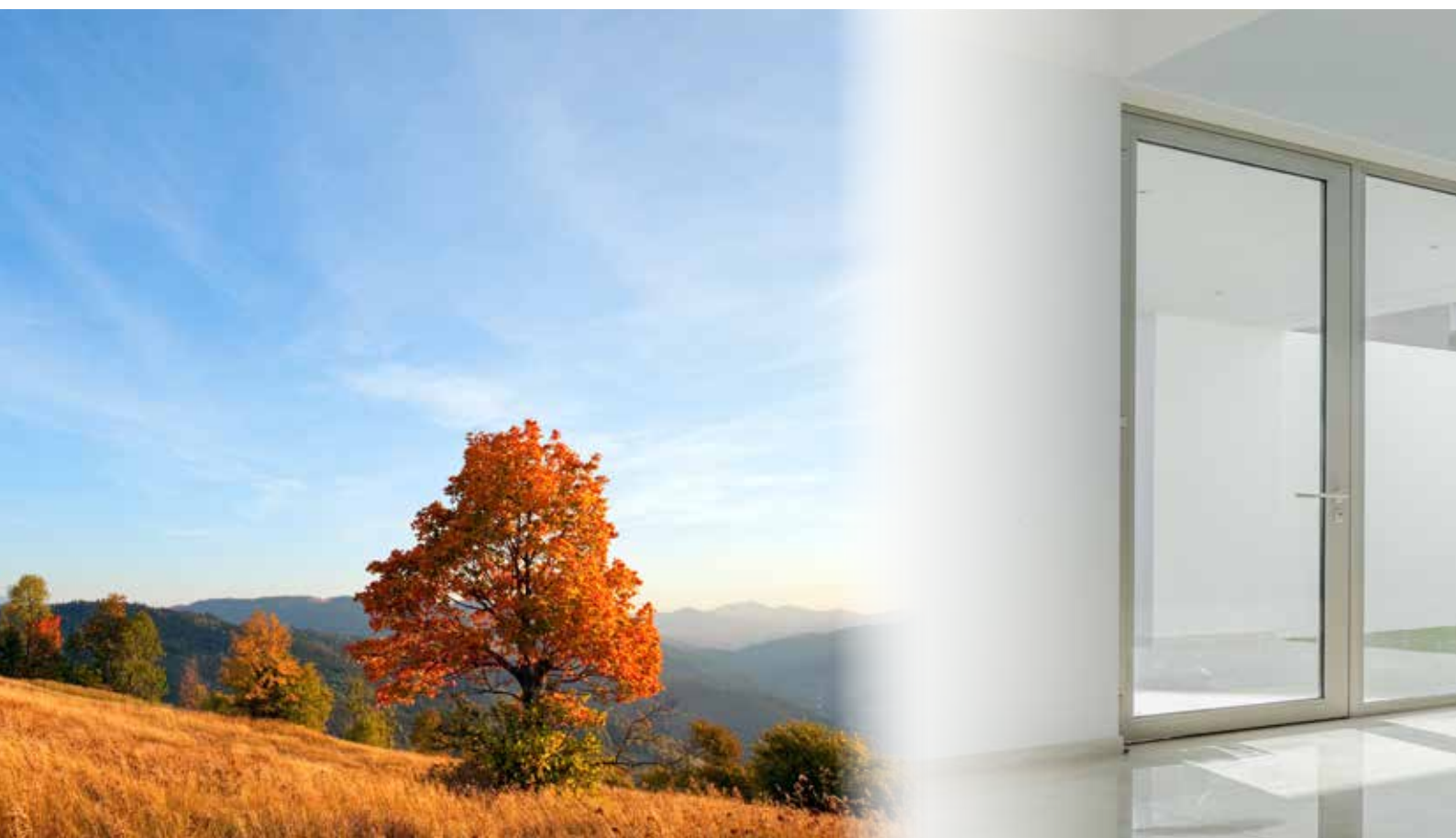
MASTERLINE 8 STANDARD

La variante High Insulation+, ad esempio, è dotata di nuove speciali barrette di isolamento realizzate con una lamina a bassa emissione che riflette e trattiene il calore, allo scopo di migliorare le prestazioni.